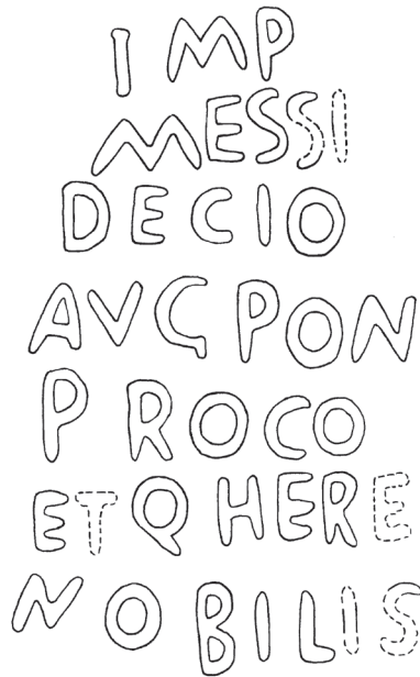
Fig. 4. Campo epigráfico del miliario de Cordovilla de Aguilar. Dibujo: A. Ruiz Gutiérrez.

IMP [CAES C] MESSI[O Q TRAIANO] DECIO [INVICTO PIO FELICI] 5 AVCPON[T MAX TRIB POT II COS II P P] PROCO[S] ET Q HERE[NNIO ETRVSCO MESSIO DECIO] NOBILIS[SIMO CAESARI - - -?]