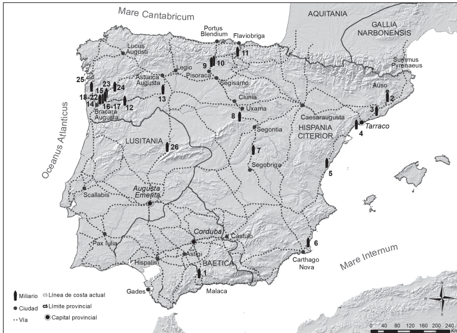
Fig. 5. Vías y miliarios de Decio en las provincias de la Hispania romana (los números remiten a la Tabla I). Mapa: J.I. Jiménez Chaparro.

Esta constatación podría relacionarse con el hecho de que Decio, antes de acceder al trono imperial, había sido gobernador de la Hispania citerior , en los años ca. 235-238 (6). Su gobierno provincial tuvo lugar bajo el reinado de Maximino el Tracio, emperador que cuenta también con un elevado número de miliarios en esta provincia, a pesar de haber ocupado el trono por espacio de solo cuatro años (235-238). Precisamente, dentro del período de Anarquía militar es el emperador mejor representado en la epigrafía viaria de la Hispania citerior , situándose Decio en segundo lugar (7).