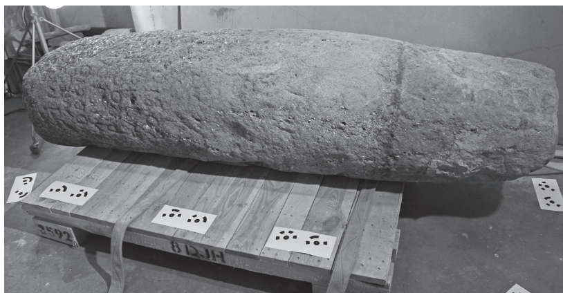
Fig. 3. El miliario en el almacén del Museo de Palencia. Trabajos de fotogrametría.

Debido al deficiente estado de conservación del soporte epigráfico, se distinguen como máximo las siete primeras letras de cada línea (Figs. 3 y 4). No obstante, es posible una lectura casi completa de la inscripción, con pocas dudas sobre la restitución de las partes perdidas del formulario: