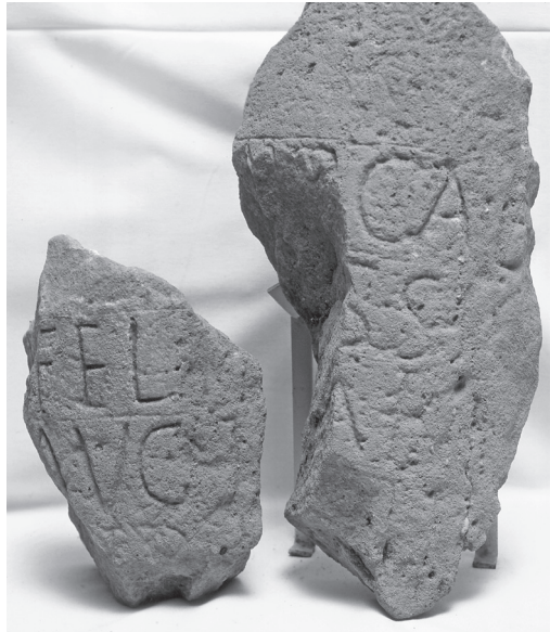
Fig. 7. Miliario de Decio hallado en Rebolledo (Valdeolea). Museo de Prehistoria y Arqueología de Cantabria.

cas del llamado Itinerario de Barro, concretamente en la Placa I, que proporciona una lista de mansiones con sus correspondientes distancias desde legio VII Gemina (León) hasta portus Blendium (32). La autenticidad de este documento, largamente discutida (33), ha sido establecida en época reciente, a través de pruebas de termoluminiscencia realizadas sobre el soporte cerámico. Los resultados de los análisis revelan que las placas pueden datarse en el intervalo de 227-310 d.C., y en el caso concreto de las Placas II y III entre los años 267 y 276 d.C. (34); por tanto, en una época cercana a la del reinado de Decio.